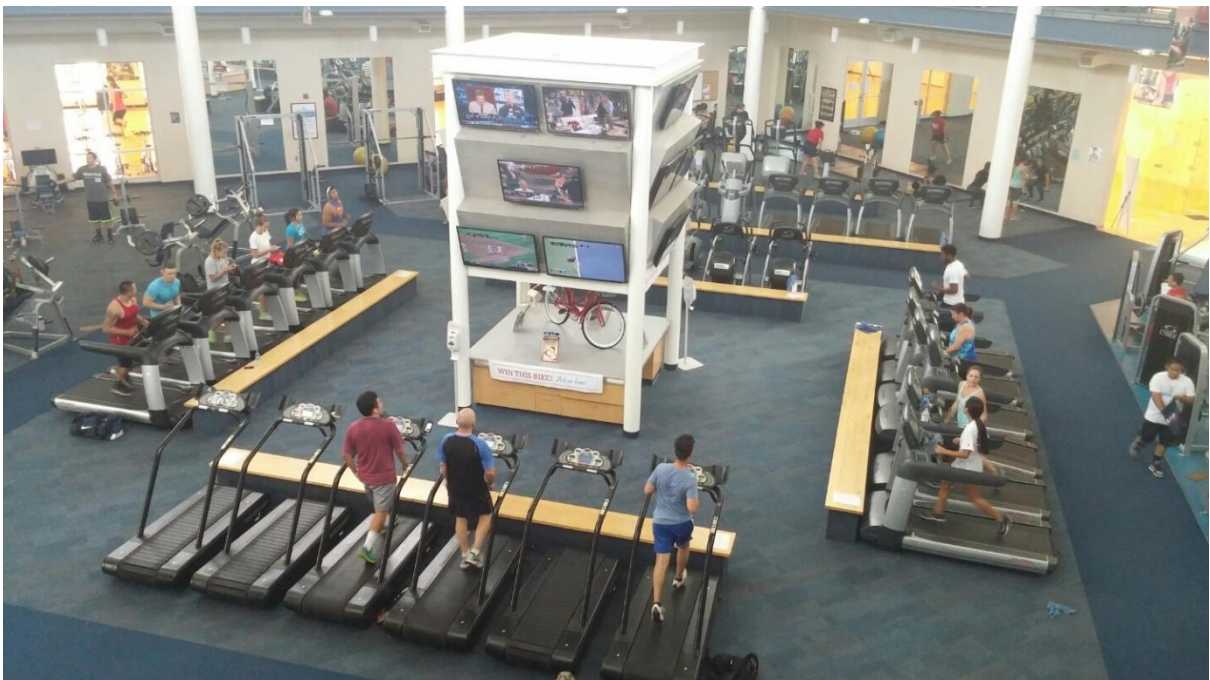
<Recreation Center 내부>

Joyal은 ISSP(국제처)가 위치하고 있으며 각종 돈을 낼 수 있는 Cashier가 있습니다. 처음에 학교를 도착하여 최대한 빨리 학생증을 만들러 ISSP에 갔다가 1층으로 내려와 사진을 찍고 학생증을 만들어야 합니다. 학생증이 있어야 밥도 먹을 수 있고, 도서관에 있는 스타벅스도 이용할 수 있으며 볼링, 포켓볼 등 학생들이 이용할 수 있는 모든 시설을 이용할 수 있습니다.