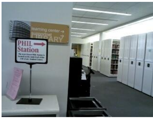
<노란색 팻말→Learning Center 위치>