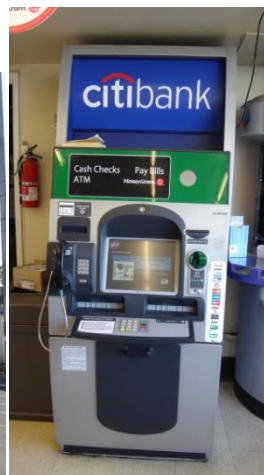
♣학교 앞 SEVEN ELEVEN ♣ATM 기

아마 학교에 처음 도착하면 당장 잘 때 필요한 이불과 베개가 없기 때문에 제일 먼저 가야할 곳이 월마트일 것이다. 월마트는 학교를 기준으로 왼쪽방향에 있다. 학교에서 월마트를 가려면 bus 를 타거나 taxi 를 부르거나 걸어가는 방법이 있다. 이곳 택시는 우리나라와 달리 도로변에서 쉽게 찾아볼 수 없고 call taxi 를 불러야 한다. 우리는 처음 도착했을 때 공항에서부터 학교까지 택시를 타고 왔는데 그때 택시기사 아저씨에게 명함을 받아서 그 전화번호로 택시를 다시 불러 월마트를 갔다 왔다. 학교에서 월마트까지의 택시요금은 미터기를 켜고 가면 약 $10 이상 나오고 팁은 알아서 계산해서 주면 된다. 혹시 택시 전화번호를 얻지 못했다면 559-222-2220 을 이용하면 된다.) 우리는 보통 $1~2 를 팁으로 주었다.