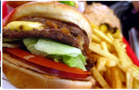
♡IN-N-OUT ♡IN-N-OUT double double burger

#우리가 이곳에 교환학생을 오기위해 준비하는 기간과 와서 적응하는 기간 동안 너무 정보가 없어서 많이 고생했는데 다음에 올 후배들은 이 수확보고서가 많은 도움이 되어서 우리보다 더 편하게 생활하며 잘 적응할 수 있었으면 좋겠다.